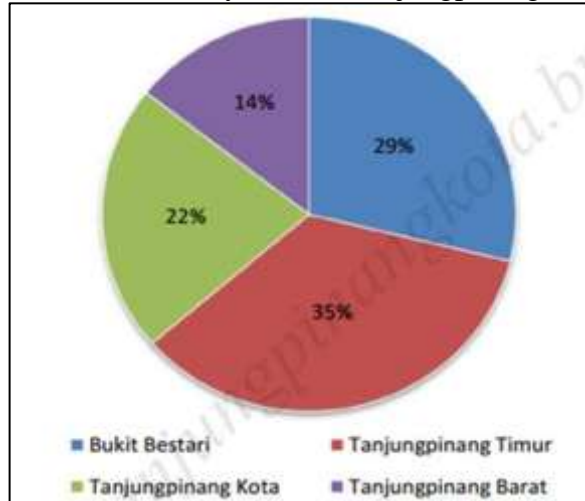
Gambar 4.1 Persentase Luas Wilayah Kota Tanjungpinang Menurut Kecamatan